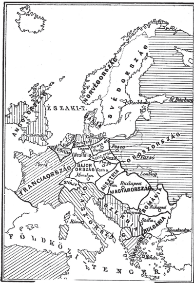
Európa térképe az antánt győzelme esetén.