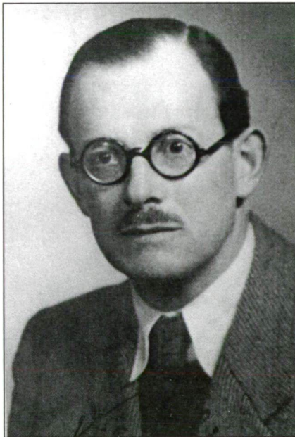
Photo 3: Sándor Vita, deputy of the Transylvanian Party in the Hungarian Parliament