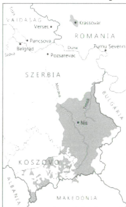
Figure 2. Spatial distribution of the Croats using the „torlák” dialect