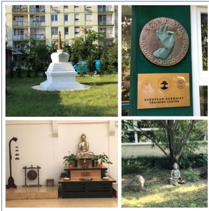
4. ábra Tan Kapuja Buddhista Egyház és Főiskola (az óvoda és az IKV korábbi épülete) (The Gate of the Doctrine Church and College )

A Magyarországon élő buddhisták aktívan jelen vannak az online platformokon, saját honlapokkal rendelkeznek, aktívan használják a közösségi média, a Web 2.0 felületeit, és saját Youtube csatornájuk is van (A Tan Kapuja néven). A Facebook-on is rendelkezésre állnak folyamatosan frissített tartalmak, illetve Buddha FM néven online rádiót üzemeltetnek, amelynek stúdiója szintén a Buddhista Főiskola területén található. Mint minden más egyház esetében, az érdeklődők tájékoztatása egyre inkább nem nyomtatott kiadványokon keresztül történik, hanem a virtuális térben, illetve személyesen. A Tan Kapuja Buddhista Egyház (5.ábra) honlapja részletgazdag, külön figyelmet fordítanak az egyes tevékenységek bemutatására, az egyház történetének ismertetésére, és az 1%-os kampányra, amely a bevételi források jelentős része. A buddhizmusban kiemelt jelentőségük van a gyakorlás körülményeinek, sokkal inkább, mint magának a konkrét térnek, erről korábban már írtam. Az otthoni vallásgyakorlás jelentősége (például hogy magánlakásokban gyűltek össze) inkább a szocialista időszakban érhető tetten.