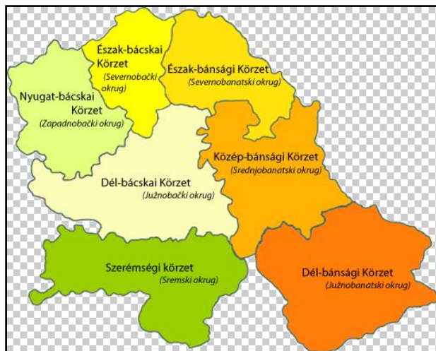
4.ábra A Vajdaságot alkotó hét körzet

Az egyes körzetek mezőgazdasági adottságait, illetve a mezőgazdasági termelés terén a Vajdaságban betöltött szerepét torzítja, hogy területük nagysága különböző. Erre a legjobb példa Észak-Bácska, amely a mezőgazdasági területeket tekintve a legkisebb szeletet foglalja el, de a körzet összes területéhez viszonyítva itt a legmagasabb a művelés alá vont területek aránya (88,9%).