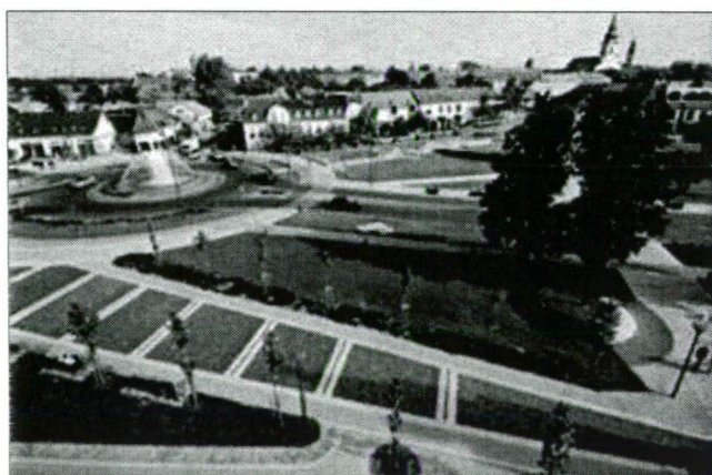
1. kép. A megújult Kossuth tér Picture 1. The renewed Kossuth square