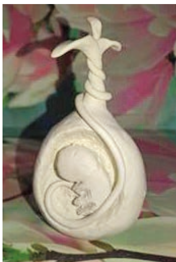
4. ábra: A Művészet szerepe a személyiségfejlesztésben kurzuson készített plasztika

4. Plasztika, modellezés: Lényegében egy már megmunkált anyagot jelent, amikor az alaktalanból alakítunk ki valamit, ami lehet szobor is (4. ábra). A plaszticitás jelentése a formálhatóság. Plasztika és szobor is nagyon sokféle anyagból formázható: fából, gipszből, kőből, fémből, viaszból, agyagból stb.