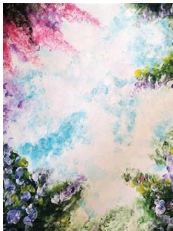
16. ábra: Ujjfestés zenére

Ha a fenti négy ábrát végignézzük, rögtön feltűnik az első alkotás komor színvilága, amely a hónapok során folyamatosan világosodott ki, a komor hullámok lecsendesedtek, és vidám, könnyed hangulatú képpel zárult a folyamat. A hallgató visszajelzése alapján az első alkalommal készült kép idején valóban problémákkal küzdött, amelyek fokozatosan megoldódtak, illetve meg tudott küzdeni velük.