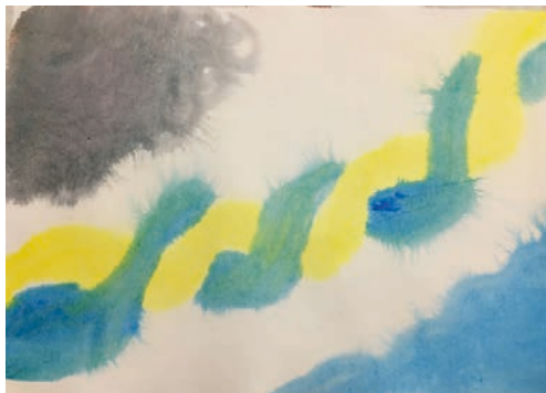
3. ábra: Példa akvarellre

3. Akvarell: Vízfesték használata ecsettel, bevizezett akvarellpapíron (3. ábra).