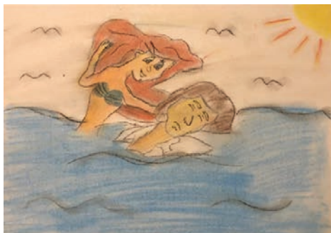
11. ábra: A megmentés

Volt, akit a kis hableány királyfi utáni vágyakozása ragadott meg (10. ábra), mást a királyfi vízből való kimentése (11. ábra), szintén mást pedig a vihar, amely kettétörte az áhított királyfi hajóját (12. ábra).