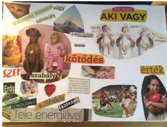
1. ábra: Példa montázsra

1. Montázs: Egy megadott témához különböző újságokból, képes újságokból kivágott képek rajzlapra ragasztása, ezáltal egy új kép megalkotása. A kivágott képek általában szimbolikusak, az alkotó számára jelentéssel bírnak (1. ábra).