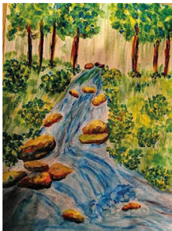
15. ábra: Versillusztráció