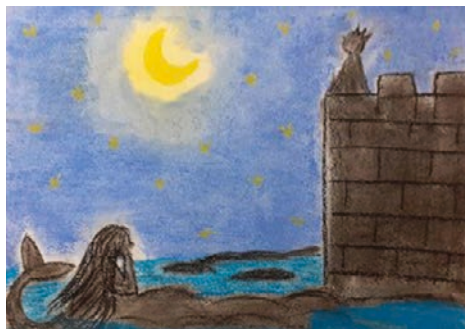
10. ábra: Vágyakozás