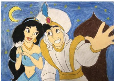
7. ábra: Kedvenc óvodáskori mese egy jelenete

merték önmagukat adni, a zenére és a versre a saját fejükben megjelenő képet lefesteni (8. ábra; a 7. és a 8. ábra ugyanannak a hallgatónak az alkotásai).