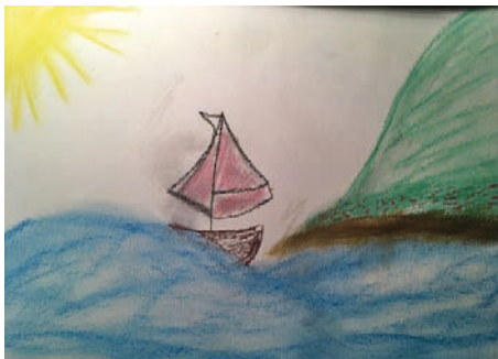
5. ábra: Példa porpasztell alkotásra

5. Krétarajz: Olajpasztell és porpasztell használata előrajzolás nélkül (5. ábra).