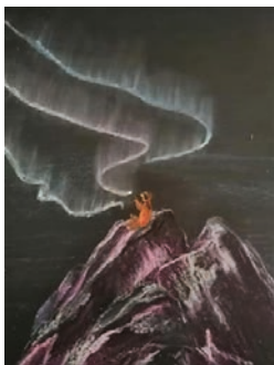
13. ábra: Saját mese

A másik elemzési szempont esetében a három hónap alatt bekövetkezett változást lehetett megfigyelni. Egyik fajtája az volt, amikor magával a módszerrel kapcsolatos ellenérzések múltak el – ahogy fentebb már jeleztem (7. ábra és 8. ábra), a másik, amikor az alkotásokból is látszott, hogy a különböző időpontokban éppen milyen volt az alkotó aktuális lelkiállapota (13–16. ábrák). Bár az adott témák különbözőek voltak, a hallgatók pillanatnyi lelkivilága visszatükröződött bennük.