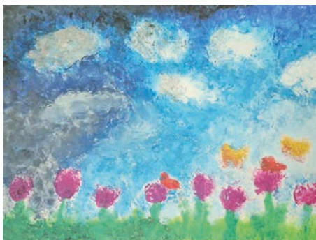
6. ábra: A Művészet szerepe a személyiségfejlesztésben kurzuson akvarelllel készített ujjfestés

6. Ujjfestés: Ecset helyett az ujjunk és akvarell vagy porpasztell használata (6. ábra).