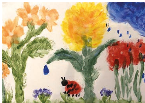
8. ábra: Versillusztráció

Egy megadott mese kedvenc jelenetének ábrázolása szintén érdekes felismerést hozott a hallgatók számára. Azzal szembesültek, hogy ugyanaz a mese mindenkinek mást jelent, legtöbbször az illető aktuális élethelyzetéhez igazodva. A hallgatóktól azt kértem, hogy olvassák el A kis hableány eredeti meséjét, és az alapján válasszák ki a kedvenc jelenetet. Már maga az eredeti mese is meglepetést okozott számukra, hiszen az máshogyan (nem happy enddel) végződik, mint a Walt Disney-változat. Ennek kapcsán nagyon élesen kirajzolódott, hogy kit mi ragadott meg, mi az, ami egybevágott az illető aktuális lelkivilágával.