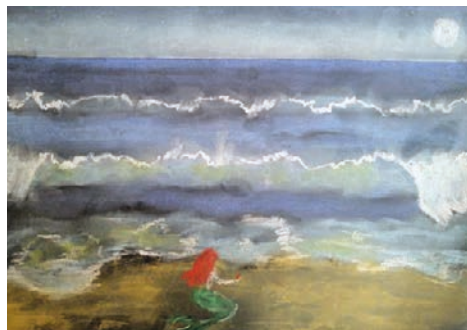
14. ábra: A kis hableány