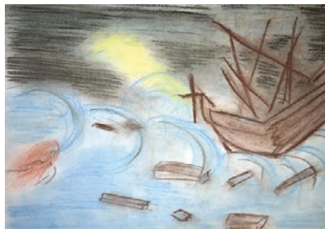
12. ábra: A vihar

A másik elemzési szempont esetében a három hónap alatt bekövetkezett változást lehetett megfigyelni. Egyik fajtája az volt, amikor magával a módszerrel kapcsolatos ellenérzések múltak el – ahogy fentebb már jeleztem (7. ábra és 8. ábra), a másik, amikor az alkotásokból is látszott, hogy a különböző időpontokban éppen milyen volt az alkotó aktuális lelkiállapota (13–16. ábrák). Bár az adott témák különbözőek voltak, a hallgatók pillanatnyi lelkivilága visszatükröződött bennük.