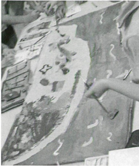
1. kép A helyszín megalkotása