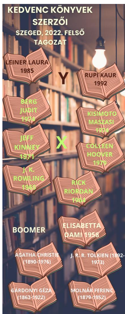
1. kép Kedvenc könyvek szerzői generációk szerint. (Szeged, 2022. felső tagozat)

A szegedi 2022-es olvasáskutatás kedvenc könyveket tartalmazó listája sokat változott az előző, a 2011-es kutatás óta. Egyfajta egyensúlyi helyzet állt be, a kieső szerzők által képviselt műfajok más szerzők révén ugyanúgy részei a listának. Bekerültek a kötelező irodalmakból is művek, maradtak benne klasszikusok és a legfrissebb nemzetközi trendekhez tartozó szerzők is megjelentek.