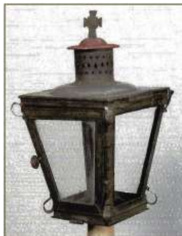
20. kép Temetési céhlámpa Csákvárról, NM 50.17.49 ltsz.

A Néprajzi Múzeum temetési céhemlékei (gyertyatartók) két településről (Csákvár és Győr), és két céhtől (fazekas és ács) származnak. Az egyik – a szerényebb változat – a csákvári fazekas céhé (20. kép). Innen négy egyforma darab került a Néprajzi Múzeumba, kisebb-nagyobb hiányokkal. A tárgyak mindegyike bádognál kialakított, forrasztott, négy oldalán üveglappal, az egyik oldal nyitható. Tetején kettős domborulat között szellőző nyílások, a csúcsán kereszt .