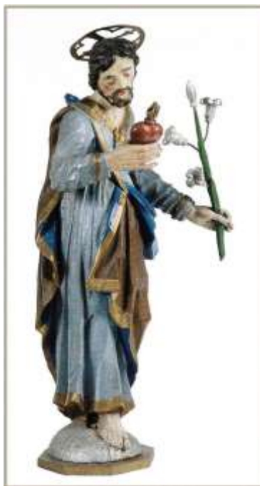
31. kép A győri ácscéh jelvénye – Szt. József szobor. XIX. század. Ltsz. C. 63.140.1

Természetesen lehetne tovább bővíteni azon céhemlékek sorát, amelyeken vallásos képek, jelek, szimbólumok lelhetők föl. A hazai közgyűjtemények szép számmal őriznek céhekkel kapcsolatos műtárgyakat, melyek további elemzésekre várnak (lásd monográfiánk irodalomjegyzékét Gráfik 2008). Ez alkalommal szerény válogatásunk az ismert vallástörténeti és szimbólumkutató (lásd Pál, Újvári 1997) ünnepli, abban a reményben, hogy megleléssel fogadja a földözött szentek által tolmácsolt köszöntésünket.