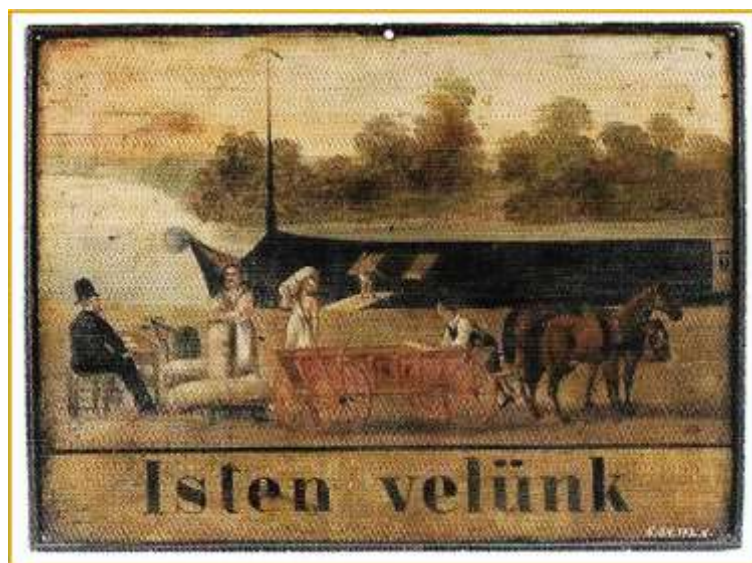
28. kép A győri napszámosok szálláshely jelvénye, 1895. Ltsz. C. 64.172.6

Végül két olyan a céhes világ életéhez kapcsolódó – a maga nemében különleges – céhemléket mutatunk be, amelyek nem vizuális, képi megjelenítéssel, hanem verbális, szöveges utalással dokumentálják a kézművesek vallásos lelkületét. Példáink szállásjelvények (28. és 29. kép) a győri Xántus János Múzeum gyűjteményéből, mégpedig olyanok, amelyek a belső használatú típust képviselik. Aminthogy utal erre – hazai és külföldi példák alapján – Nagybakay Péter is: „a szállásjelvények másik nagy csoportját azok alkotják, amelyek minden valószínűség szerint nem az épületen kívül, a kapu vagy ajtó fölött jelezték a szálláshelyet, hanem amelyek az épületen belül a herberg szobában (Stubenschild), vagy a vendégfogadó nagytermében egyes asztalok fölött, a falra akasztva, falba vágott fülkében, de még inkább lámpaszerűen lelógva (Hägeschild) hívták fel a figyelmet a céh herbergjére” (Nagybakay 1971: 169; vö. Isenberg 1934: 31 és 63; valamint 6. és 19. kép).