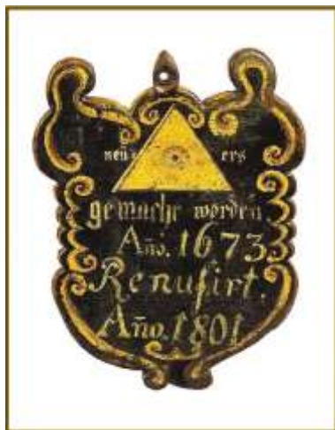
30. kép A csornai vegyes céh behívótáblája, NM 76.29.1 ltsz.

Legvégül, mivel is zárhatnánk tanulmányunkat, mint két olyan műtárggyal, melyek mind-egyike különleges megformálással és szimbolikával idézi föl a céhek vallásos vonatkozásokban gazdag életét. Az egyik egy korai datálású (1763), majd 1801-ben megújított céhbehívótábla (30. kép). E tárgy egyik oldalán a népi kultúra más területein gyakrabban előforduló isten-szem-motívum látható. A vegyes céh behívótáblájának a másik oldalán, ennek megfelelően nyolc kör alakban különböző mesterségek festett címei láthatók (lakatos, asztalos, szűcs, fazekas, kádár stb.) A másik egy olyan kisplasztika, melyeket templomokból, kápolnákból, utak menti kegyszobrokat befogadó nyitott, vagy zárt kisépítményekből ismerhetünk. A tárgy az ácsok védszentjének ( Szent József ) népies, ám nem lebecsülendő provinciális stílusú megjelenítésével hű kifejezője és bizonyítéka a népi vallásosság széleskörű beágyazottságának a jelentős létszámú kézműves társadalmi csoport, réteg életébe (31. kép).