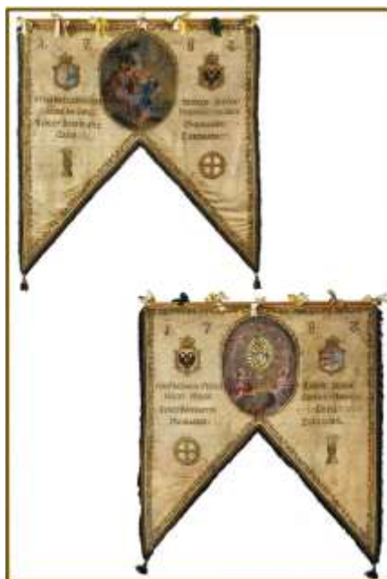
12. kép A szigeti molnárcéh zászlója, 1782. Ltsz. C.64.147.1

A 11. képen a felső zászlókép Szent Severinust ábrázolja ornátusban, pásztorbottal, fején fehér mitra, két oldalt egy-egy szárnyas angyalfej. A takácsok védőszentje egykor a ravennai takácsmesterből püspökké lett Severus volt, alakja a névbeli hasonlóság révén a 18. században már teljesen összefonódott a kölni püspök Severinus személyével. Így került a hazai céhek köztudatába. Az alsó képen a bibliai passiótörténetből ismert Szent Veronika látható. Kezében a Krisztus arcvonásait őrző kendő, mely a takácsok számára a szent céhzászlóra helyezését motiválta.