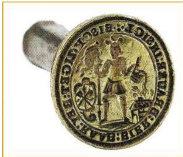
24. kép A győrszigeti sörfőzőcéh pecsétje , XVIII. század. Ltsz c.62.27.2

A győri Xántus János Múzeum három változatát is őrzi a sörfőzők céhe pecsétnyomóinak. Az egyik kisebb méretű tipárium (24. kép), csakúgy, mint a másik kettő – a sörfőzők mintegy tucatnyi védszentje közül – Szent Flóriánt ábrázolja, akit a köznyelv leginkább a tűzoltók védőszentjeként ismer. „A hagyományos római katonaként megjelenített Szent Flórián baljában zászlós lándzsát tart, jobb kezében csobolyóval egy égő házat olt. A voltaképpeni céhcímer – árpakalászon keresztbe tett zurboló és nyeles mérőedény – ovális pajzsban a védőszent bal lábánál kapott helyet” (Nemesné Matus, Szabó 2010: 93). (Zárójelben megjegyezzük, hogy Szent Flórián kezében inkább egyfajta nyeles dézsa, mintsem csobolyó van.)