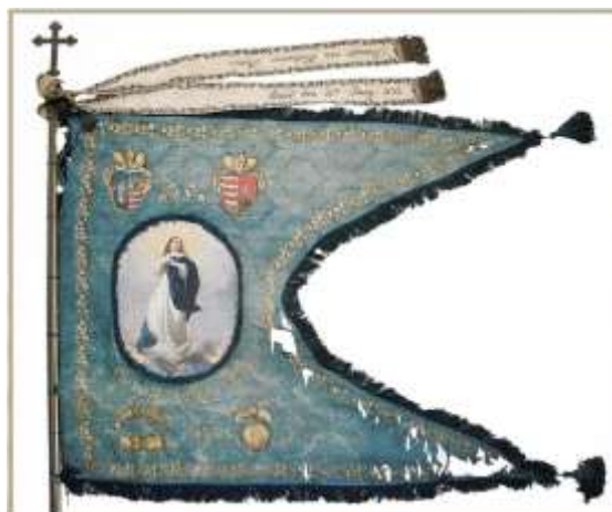
6. kép A győri polgári német fehérpékcéh zászlója, 1833. Ltsz. 56.65.6

A hazai közgyűjtemények egyik gazdag céhzászló gyűjteménye a győri Xántus János Múzeumban található. A győri múzeum céhemlékeiről igényes szakmai földolgozás jelent meg (Nemesné Matus & Szabó 2010), példáink nagyobb részét is e kötetből válogattuk (6-9. és 11-12. kép).