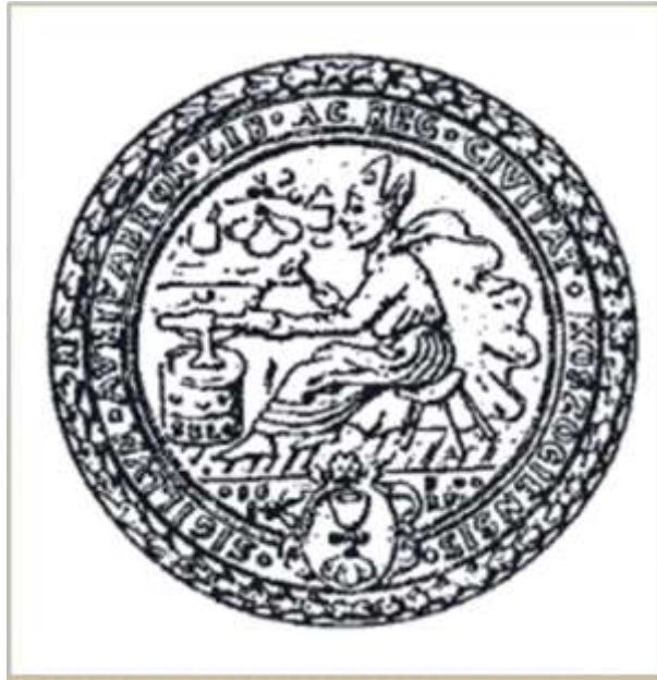
23. kép A kőszegi ötvös céh pecsétképe. 1650. (Nagy 2008: 63 nyomán)

A kőszegi ötvös céh 1650-ben készült pecsétképében védszentjük ábrázolása látható (23. kép). „Az Európa-szerte tisztelt Szent Eligius , a franciaországi Noyon püspöke teljes papi ornátusban, háromlábú széken ülve, kalapáccsal a kezében, üllő fölé hajolva dolgozik. A lába alatti képmezőben a céh jelvénye a talpas kehely. Az ötvösök pecsétnyomóinak körirata mindig latin nyelvű, mely széles körű kapcsolataikra utal” (Nagy 2008: 34–35).