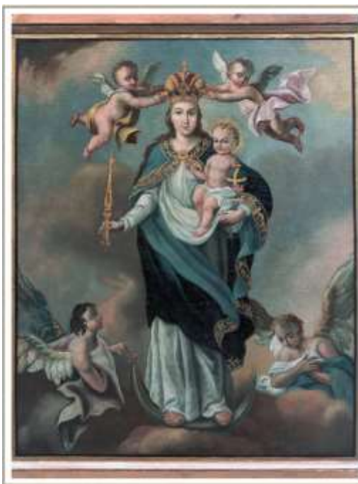
18. kép A szombathelyi szűrszabó céh zászlóképe angyalok által körbevett Sarlós Boldogasszony ábrázolással. (A Szent Márton Plébánia tulajdonában)