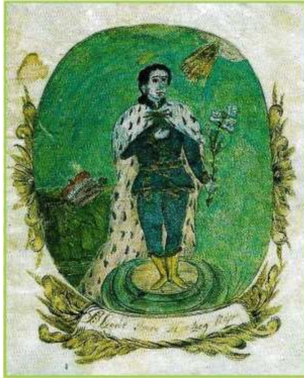
27. kép A győri csizmadiák jegyzőkönyvének címoldala. (Nagy 2008: 12 nyomán)

Végül két olyan a céhes világ életéhez kapcsolódó – a maga nemében különleges – céhemléket mutatunk be, amelyek nem vizuális, képi megjelenítéssel, hanem verbális, szöveges utalással dokumentálják a kézművesek vallásos lelkületét. Példáink szállásjelvények (28. és 29. kép) a győri Xántus János Múzeum gyűjteményéből, mégpedig olyanok, amelyek a belső használatú típust képviselik. Aminthogy utal erre – hazai és külföldi példák alapján – Nagybakay Péter is: „a szállásjelvények másik nagy csoportját azok alkotják, amelyek minden valószínűség szerint nem az épületen kívül, a kapu vagy ajtó fölött jelezték a szálláshelyet, hanem amelyek az épületen belül a herberg szobában (Stubenschild), vagy a vendégfogadó nagytermében egyes asztalok fölött, a falra akasztva, falba vágott fülkében, de még inkább lámpaszerűen lelógva (Hägeschild) hívták fel a figyelmet a céh herbergjére” (Nagybakay 1971: 169; vö. Isenberg 1934: 31 és 63; valamint 6. és 19. kép).