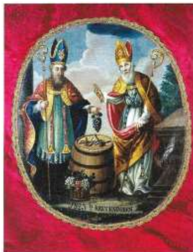
15. kép A bodnár céh zászlója (Herman Ottó Múzeum, Történeti Gyűjtemény. Ltsz. 53.1547.1. -)

A bodnár céh zászlóján látható másik alak Szent Valerius püspököt ábrázolja. A kép azt a jelenetet örökíti meg, amikor egy hordó felett (mely egyértelmű utalás a bodnárok legfontosabb termékére) Vince egy szőlőfürtöt tart a kezében, amit Szent Valerius püspök megáld. A hordó tetején a hordókészítő mesterség legfontosabb szerszámai fekszenek, többek között a körző és a gyalu. A kép alján szerepel a zászlókészítés dátuma: 1823. augusztus 3. , illetve jobb oldalt a zászló megújításának időpontja: 1843. július 28. A zászló tetején A Ns: bodnár céh zászlója 1843 felirat olvasható.