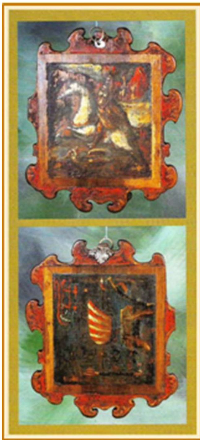
10. kép A győri fegyvercsiszár (egyest) céh behívótáblája, NM 83.62.1 ltsz.

Itt – több oknál fogva is – közbeékelünk egy ugyancsak győri eredetű tárgyat, melyet a Néprajzi Múzeum őriz. Meglehetősen ritka az előfordulása annak, hogy a céhek úgynevezett behívótábláin – melyek körbehordozásával hívták egybe a tagságot – vallásos ábrázolás található. A műtárgy, az évszám bizonytalan olvasata ellenére, a múzeum legkorábbi datált behívótáblái körébe tartozik (10. kép).