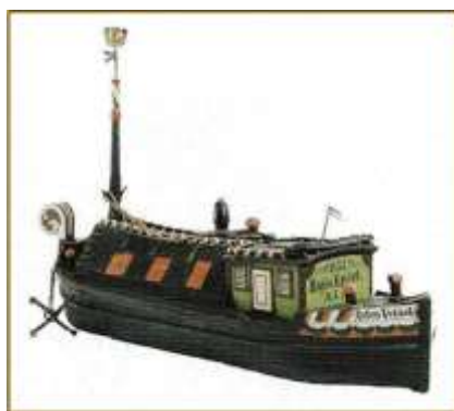
29. kép A hajósok szálláshely jelvénye, 1835. Ltsz. C. 64. 159.1 A legendás gabonaszállító, úgynevezett bőgőshajó makettje, a hajótest végén „Isten Velünk” felirattal.