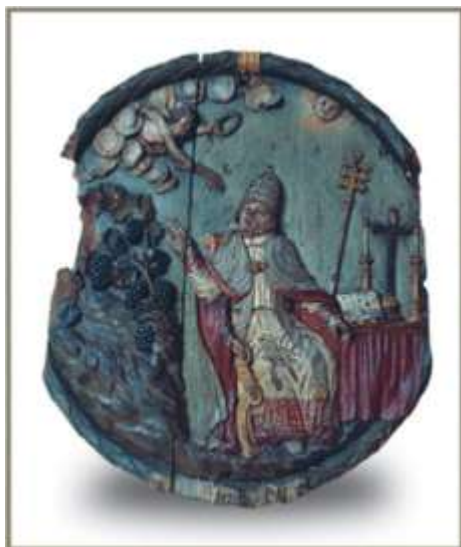
16. kép Hordóvég Szent Orbán ábrázolással a győri Xántus János Múzeum állandó kiállításában.

A hordó kapcsán újabb közbevetést teszünk. Ismerünk ugyanis olyan műtárgyat, mely vélhetően nem céhemlék, de a kádár (pintér, bodnár) mesterek remeklése népművészeti szempontból is különös figyelmet érdemel. A hordófenék (16. kép) művészi megmunkálása kivételes faragótechnikáról tesz bizonyosságot. A győri Xántus János Múzeum gyűjteményében van az ez a műtárgy, amelyen a kádárok védszentje, Szent Orbán teljes ornátusban ábrázolt alakjának gazdag ikonográfiai megjelenése, valamint a szőlő – Krisztus teste – plasztikus ábrázolása figyelhető meg (Nagy 2008: 47–48).