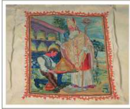
19. kép A sárvári méhészegyesület zászlójának részlete, 1934. (Sárvári Nádasy Múzeum 2007.2.1 ltsz)

Zászló mustránk végén álljon itt a sárvári méhészegyesület zászlóképe 1934-ből, mely arra bizonyíték, hogy a céhzászlók hatására, előbb a céhek helyébe lépő ipartestületek, majd a különböző egyesületek mintaként kezelve az egykori céhzászlókat, készítették/készítették el saját zászlóikat (19. kép).