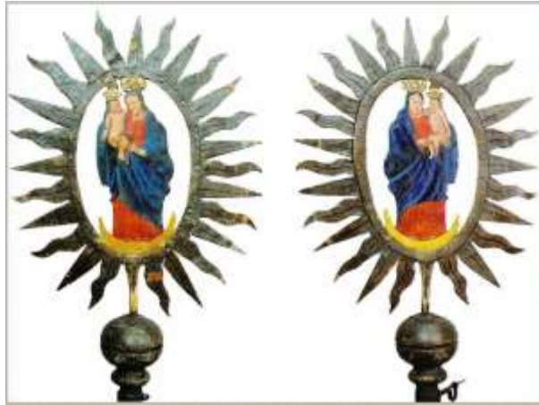
2. kép Halász céhzászló csúcsdísze, NM 34350 ltsz.

Erről a tárgyról, és a leíró kartonon nem szereplő, de hozzá tartozó zászlóról azonban sokkal többet tudunk! S minden túlzás nélkül állíthatjuk, hogy az egyik legbecsesebb érték, a keszthelyi halászok céhének zászlója (3. és 4. kép). Gyűjtője Jankó János volt, aki balatonfelvidéki kutatásai során szerezte meg a Néprajzi Múzeumnak, és ismertette is A Balatonmelléki lakosság néprajza című könyvében (Jankó 1902: 324; 64. ábra; V. tábla).