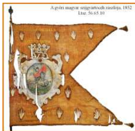
9. kép A győri szíjgyártócéh zászlója.

A kép Illés próféta jellegzetes ikonográfiai megjelenítése.