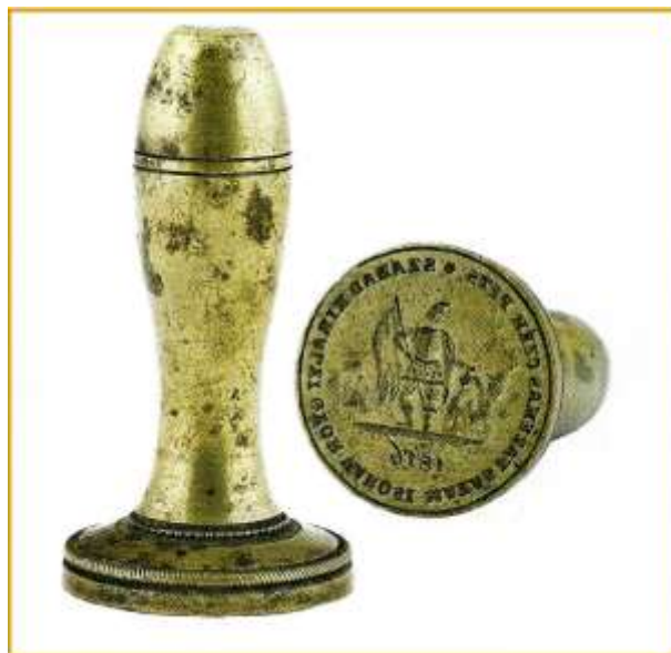
25. kép A győri magyar mázasfazekas-céh pecsétje, 1816. Ltsz. C. 62.34.2 Hagyományos Szent Flórián ábrázolással.

S ha már szóba került Szent Flórián védőszent volta, akkor lássunk egy példát a fazekascéhek köréből (25. kép). Ugyanis, mindazoknál a kézműves mesterségeknél előfordul/hat védszentként, ahol tűzzel dolgoznak. Így a már hivatkozott sörfőzők mellett a kádároknak, pékeknek, kovácsoknak, szappanfőzőknek, kályhásoknak és persze a fazekasoknak is lehetett választott védőszentje. Ünnepe május 4. Rendesen római katonai öltözékben ábrázolják, amint égő házra dézsából vizet önt.