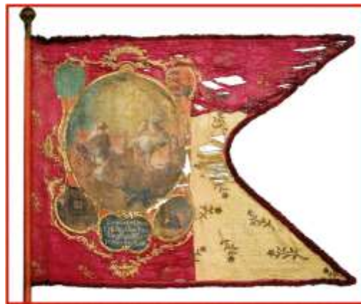
8. kép A győri országos kocsiscéh (fuvarosok) zászlója. 1769. Ltsz. 56.65.7

A 7. képen látható zsúfolt zászlókép bővebb magyarázatot igényel. Az előtérben a díszes papi öltözet és a kép fölé írt idézet szerint az ószövetségi Áron ábrázolták, kezében a virágos vesszővel, mely az Úr által kiválasztást jelképezi. „ Áron személyének a gombkötő szakmával való kapcsolatát főpapi méltósága magyarázza, elsősorban a szentírásban megörökített díszes öltözék feltételezett gombkötő munkái révén, melyet a képen a 18. századi felfogás szerint ábrázolt bojtos zsinóröv jelez. A kép háttérében megjelenik a frigyláda , amelyben Áron vesszejét is őrizték. Maga a frigyládahordozás Áron halála után történt. A kép felirata a főpapi áldást idézi. Áron és a frigyládahordozás jelenet mögé Jerikót festették” (Nemesné Matus & Szabó 2010: 116.).