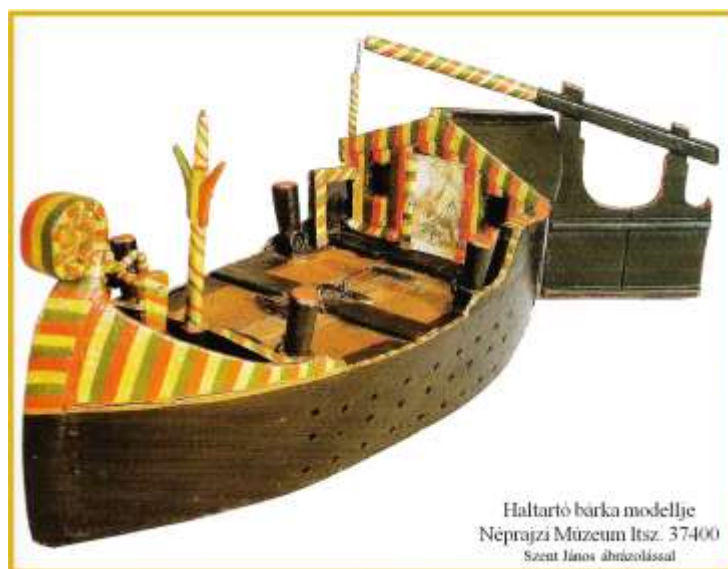
13. kép A haltartó bárka modell fedett helyiségének ajtaján festett képen Szent János látható