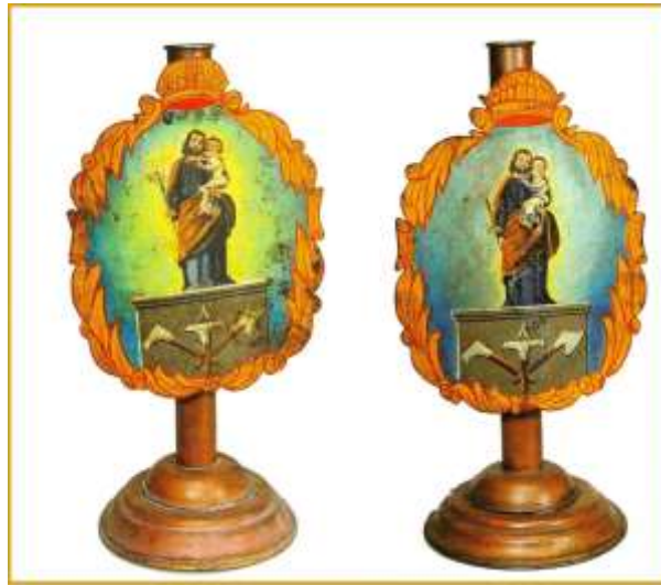
21. kép A győri ácsszék temetési gyertyatartói, NM 83.8.1 és 83.8.2 ltsz.