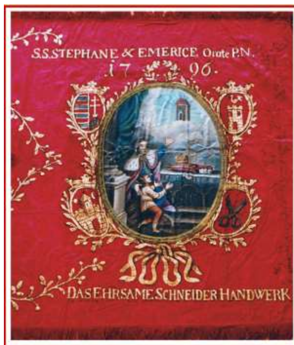
1. kép A szombathelyi szabó céh zászlójának részlete (1796) Szent István és Szent Imre ábrázolásával. (Nagy 2008: 41. és 68. oldal nyomán)

A céhek zászlókészítési kötelezettségét a XVIII. század közepétől szinte minden uralkodótól származó kiváltságlevél előírta, mégpedig több körülményre kitérően. A céhzászlók többnyire nem tartoztak ugyan a művészi alkotások csúcsteljesítményei közé, de elkészíttetésük anyagi terhet jelentett a céhnek, illetve a tagoknak.