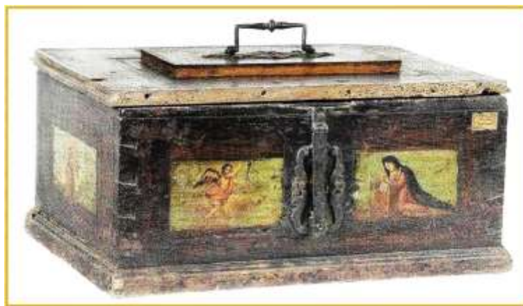
26. kép A győri takácscéh ládája, XVII. század. Ltsz. 54.4.1

Nem tekinthető gyakorinak – az egyébként többnyire mives asztalosmunkaként készített – céhládáknak a vallásos-biblikus képekkel, szimbólumokkal való díszítése. Többségüket feliratok, évszámok, a mesterségre utaló szerszámok, faragások, festett virágzások, vasalások, kulcspajzsok, ritkábban intarzia, díszítik. A céh legfontosabb iratait, pecsétjét, behívótábláját helyezték el benne, s rendszeren a céhmester őrizte. A győri céhláda az úgynevezett komáromi ládák típusába sorolható (26. kép). Megviselt állapota ellenére fontos dokumentum, különösen az elő- és oldallapján látható festett képek érdemelnek figyelmet. A kvázi kazettákban az Angyali üdvözet , Szent Péter és Szent Pál apostolok láthatók.