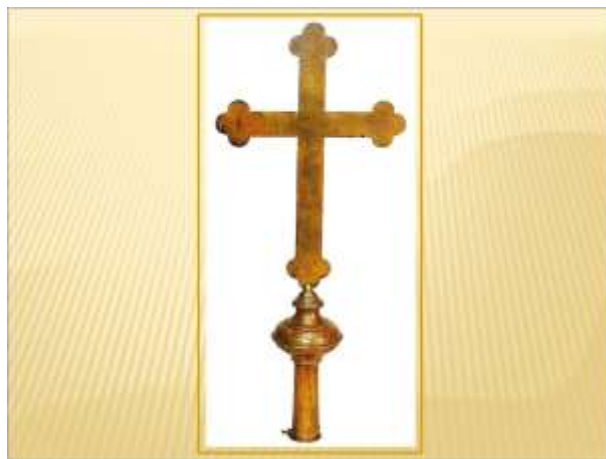
5. kép Zászlócsúcs NM 61.77.8 ltsz.

A keszthelyi múzeum állandó kiállításának katalógusában a céhzászlóra vonatkozó muzeológusi leírásban az alábbiak olvashatók: „A halászcéhek patrónusa általában Péter és Pál apostol, de a keszthelyieké szt. András volt. Az 1871-ben felújított zászló (fríz jobb 3.) egyik oldalán levő képen a bödönhajóban ülő, halászó apostolok valószínűleg a csodálatos halfogást köszönik meg a parton álló Krisztusnak. A másik oldalon Mária áll angyaloktól körülvéve. A képtől balra a keszthelyi halászcéh címere van: a bödönhajóban ülő halász háromágú szigonyával egy halat döf le. A csónak elé és mögé 1-1 horgot festettek. A zászlót a templomban tartották, és köréje tömörülve hallgatták meg a büntetés terhe mellett kötelező ünnepi szentmisét. Minden céhnek külön zászlója volt, és körmenetek alkalmával a céhek előtt vitték, aki az előre megszabott rend szerint követték egymást a menetben” (Petánovics 1987: 11).