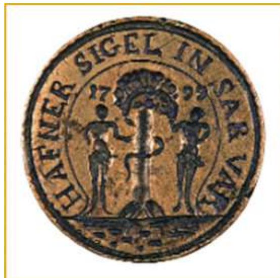
22. kép A sárvári fazekas céh pecsétnyomója. 1799. (Nagy 2008: 77 nyomán)

A céhek életében fontos szerepet töltöttek be az irataikat hitelesítő céhpecsétek (22–25. kép). Ezek ritkábban ábrázolják a védszenteket, de találunk olyan példányokat, melyeken a szövegek, szerszámok, évszámok mellett vallásos-biblikus képek, szentek ábrázolása is megjelenik.