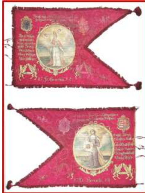
11. kép A győri német kelmekészítő- és lenszövőmesterek zászlója, 1788. Ltsz. C.65.60.1.1

A tárgy a második világháború utánig a győri Bencés Gimnázium tulajdona volt; s már az iskola 1870 körüli, nyomtatottan megjelent Értesítőjében szó van e céhbehívó tábláról. A Néprajzi Múzeum egy műgyűjtőtől vásárolta meg. Keményfából kialakított téglalap alakú tábla, amelynek a széle körös-körül csipkésre faragott. Mindkét oldala színes festésű. Egyik oldalon a fegyvercsiszár céhre jellemző tárgyak ábrázolásai láthatók: kard, dárda, pajzs, buzogány, lószerszám és nyereg, valamint festett évszám (1637?). A tábla másik oldalán a fehér ló hátán ülő Szent György viaskodása, rutinos vonalvezetéssel megfestve.