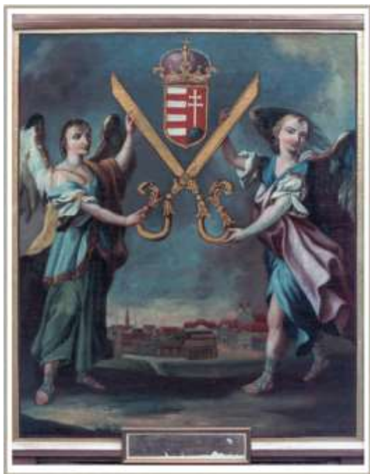
17. kép A szombathelyi szűrszabó céh zászlójának részlete Szombathely városképével, 1820. Angyalok tartanak tágra nyitott ollót, melynek ágai között koronás magyar címer. (Nagy 2008: 70. oldal nyomán)

További céhzászló részletekkel a vallásos jelenetek, szentek ábrázolása mellett, a képkötés, képformálás változataira hozunk tanulságos és figyelmet érdemlő példákat (17-18. kép).