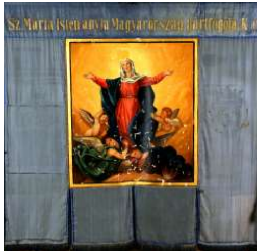
3. kép A halász céhzászló egyik oldala (Gráfik 2008: 159.)

Erről a tárgyról, és a leíró kartonon nem szereplő, de hozzá tartozó zászlóról azonban sokkal többet tudunk! S minden túlzás nélkül állíthatjuk, hogy az egyik legbecsesebb érték, a keszthelyi halászok céhének zászlója (3. és 4. kép). Gyűjtője Jankó János volt, aki balatonfelvidéki kutatásai során szerezte meg a Néprajzi Múzeumnak, és ismertette is A Balatonmelléki lakosság néprajza című könyvében (Jankó 1902: 324; 64. ábra; V. tábla).