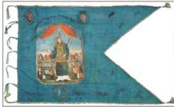
7. kép A győri gombkötőcéh zászlója. 1812, ltsz. C.83.9.1

Az ikonográfiában általánosan elterjedt Immaculata -ábrázolás; Mária földgömbön és hold-sarlón áll, jobb lábával kígyó fején tapos, feje felett 12 csillag. A zászlótartó rúd végén kereszt.