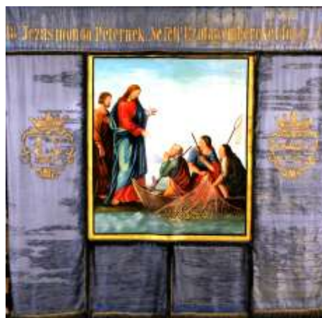
4. kép A halász céhzászló másik oldala (Gráfik 2008: 159.)

Az eredetileg egymáshoz tartozó unikális céhemléket; a céhzászlót és a zászlócsúcsot azonban nem lehet együtt látni, ugyanis míg a zászló (zászlócsúcs nélkül) a keszthelyi Balatoni Múzeum állandó kiállításában megtekinthető, a zászlócsúcs a budapesti Néprajzi Múzeum raktárában van (Petánovics 1987: 11, illetve Gráfik 2008: 158–159).