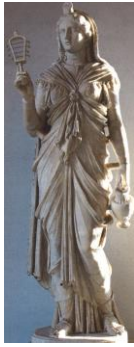
8. kép Isis római kultuszszobra kezében szisztrummal és kancsóval, 1. század (Róma, Vatikáni Múzeum)