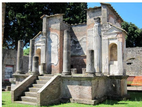
6. kép: Isis-templom, Pompeji 1. század

Az egyiptomi istenségek népszerűségnek örvendtek a Severus-dinasztia alatt is. Septimius Severus (ur. 193–211), portréi gyakran Sarapis alakjában ábrázolják a dinasztia alapítóját. Úgy vélték, hogy ez az istenség biztosítja a birodalom jólétét, attribútumai között gyakran szerepel