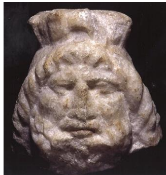
10. kép Sarapis kultuszszobor töredék (Szombathely, Iseum Savariense Régészeti Műhely és Tárház)

a mákszár és a fejére helyezett modius, a gabona mérésére használt edény. Sarapis garantálhatta a katonai sikert is, ahogyan azt az érméken ábrázolták (Mráv 2016: 31). Egy Sarapis szobor-töredék, fején a gabonamérő edénnyel, a szombathelyi Iseum régészeti leletei között is szerepel (lásd 10. kép).