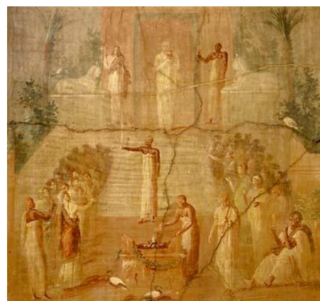
7. kép: Isis szertartást ábrázoló freskó, Herculaneum, 1. század (Nápoly, Museo Archologico Nazionale)