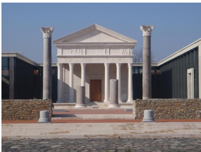
12. kép. Szombathely, a rekonstruált Iseum és az Iseum Savariense Régészeti Műhely és Tárház épülete

2011-ben az Európai Unió ERFA pályázati támogatásnak köszönhetően, a kutatási eredmények alapján, eredeti méreteikben állították helyre Isis savariai kultuszhelyét, a 3. századi állapotnak megfelelően. Az egykori szentélyt övező folyosó és cellarendszer helyén múzeum mutatja be a savariai és pannoniai római kori élet és vallási kultúra fennmaradt emlékeit (lásd 12. kép).