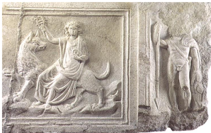
11. kép. A Szóthisz-kutyán ülő Isis és Mars, az Iseum frízének domborművei, 3. század (Szombathely, Iseum Savariense Régészeti Műhely és Tárház)

asztrológiai hagyományokra, amelyek Isist a Nílus áradását jelző Kutya csillagképhez, annak is a legfényesebb csillagához, Sirrushoz/Sothishoz kötik. E szerint „A csillagok közül a Sirius szerintük Isisé, mert a víz áradását hozza” (Plutarkhosz 1986: 40); valamint „Iszisz lelke a Kutya-csillag, az egyiptomiak... Szóthisznak nevezik” (Plutarkhosz 1986: 25). A Chios szigetén fennmaradt Isist dicsőítő feliraton is történik utalás a kutya attribútumra: „Nyáron a Kutya-csillagzaton tartózkodom” (Szentlélek 1960: 7). A késő ókor hellenizált Egyiptomában keletkezett, Hórapollón szerzőségével jelzett Hieroglühphika kézirat szintén a Szóthisz/Szíriusz csillag Isissel való azonosítását fogalmazza meg: „...Ízisz egy csillag, amelyet egyiptomi nyelven Szóthisznak, görögül Asztroküónnak (Kutyacsillagnak) neveznek. Szerintük ez uralkodik a többi csillag felett” (Hórapollón 2020: 31). A csillag feltűnése az újesztendő kezdetét jelölte, fényességéből a termésre és a jövőre vonatkozóan jósoltak.