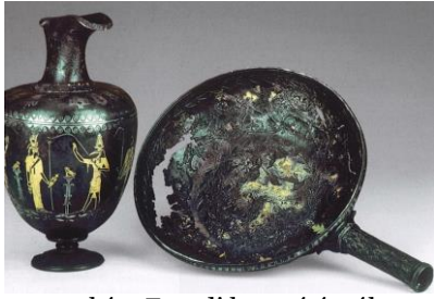
1. kép: Egyedi kancsó és tál (Magyar Nemzeti Múzeum)