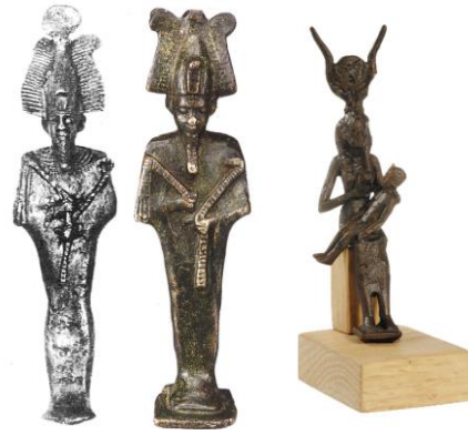
3. kép: Osiris, bronzplasztika Bátaszékről (Magyar Nemzeti Múzeum)