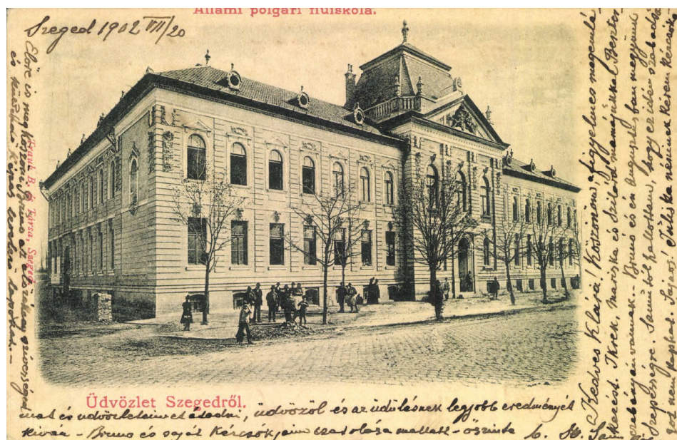
2. kép. A III. kerületi polgári fiúiskola, ma az SZTE Juhász Gyula Pedagógusképző Kar főépülete 6

Az első polgári iskolát 1899-ben államosították, és az 1885-ben az iskola mellett szervezett közép kereskedelmi iskolával együtt a Tisza-partján felépített szép épületbe költözött. A megnövekedett tanulói létszám miatt 1911-ben újra költözni kényszerültek, ezúttal a Madách utcába. A Tisza-parti épület ma a Körösy József Közgazdasági Technikum, az új székhely pedig a Madách Imre Két Tanítási Nyelvű Általános Iskola épülete.