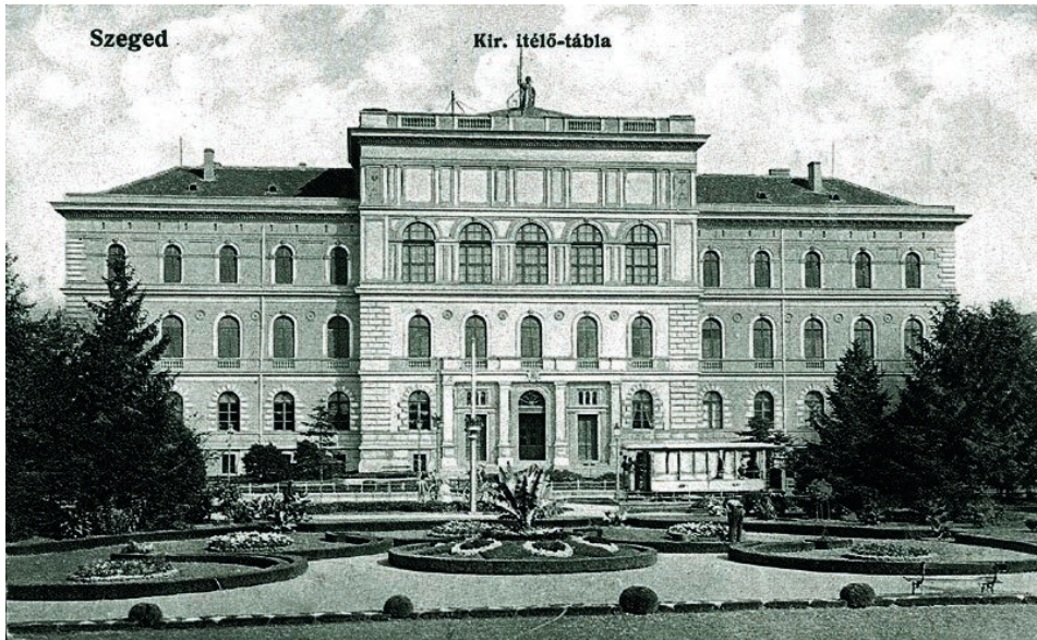
1. kép. A Főreáltanoda, majd a kir. Ítélőtábla épülete, 1921-től az egyetem főépülete 4

A négy utcára tekintő hatalmas kétemeletes épületben már 1873-ban megkezdődött az oktatás. 1883–1894 között a Somogyi Könyvtár épülete is volt, majd 1894-től a királyi ítélőtábla működött a falai között. 1921-től a szegedi egyetem központi épülete lett, és az ma is (Blazovich, 2005. 85–127.; Kovács és Vida, 2016).