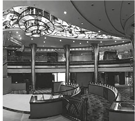
7–8. kép. A queer rendezvények gyakori helyszíne az illusztris Kaszinó