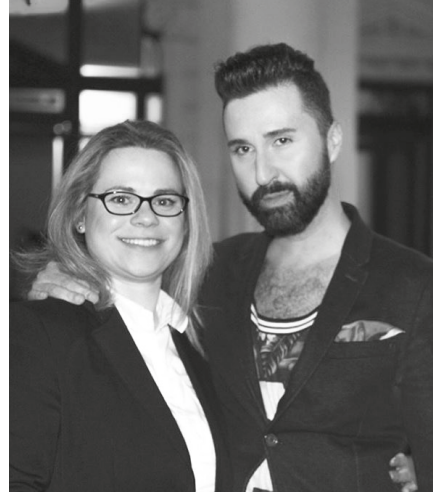
3–4. kép. Queer megjelenés a dandy stílus jegyében

De nem ritka az extravagáns, meghökkentő, már-már jelmezszerű kinézet sem.