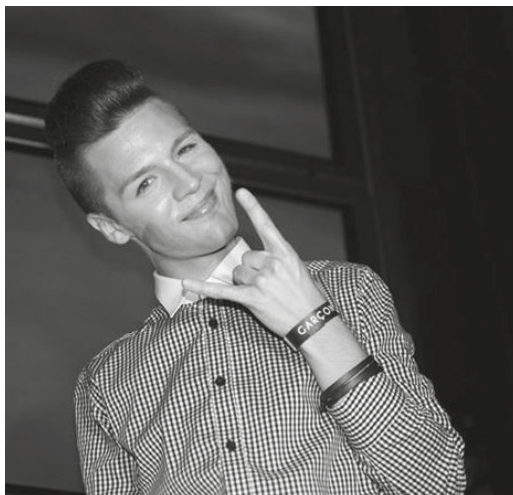
1–2. kép. Queer fiatalok az egyik legnépszerűbb ruhadarabban: elegáns ingben

Megjelenésüket tekintve érvényüket veszítik az olyan hagyományos kategóriák, mint a nőies vagy a férfias. Mindkét nem stíluskellékeiből, ruhadarabjaiból, kiegészítőiből válogatnak egyszerre. A természetes hatású, szinte láthatatlan smink például éppúgy elengedhetetlen a férfiak számára, mint a gondosan elkészített frizura.