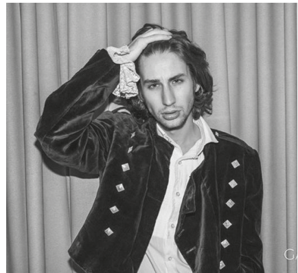
5–6. kép. Queerek teátrális öltözékben

Az ilyen jellegű megjelenés azonban leginkább a kifejezetten queereknek szervezett, tematikus partikon gyakori. Ezek azok az alkalmak, amikor félelem nélkül, nyíltan felvállalhatják nemi identitásukat, valódi arcukat, anélkül, hogy ennek bármiféle negatív következménye volna. Míg pl. San Franciscóban külön kultúrközpont működik a queer közösség és művészet támogatásáért (Queer Cultural Center: http://www.queerculturalcenter.org/ ), addig nálunk ezek az események jelentik számukra a közösségépítés szinte egyetlen lehetőségét.