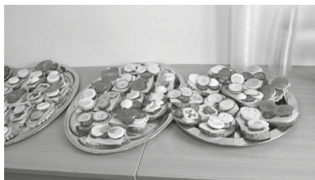
1. kép. Helyi alapanyagokból készített szendvicsek

A csoportok értékelték saját magukat, társaikat és a zsűri is értékelte a feladatokat.