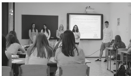
4. kép. Az osztály a Projektnapon