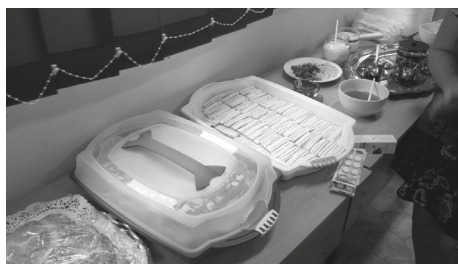
2. kép. A Fertő-táj jellegzetes süteményei