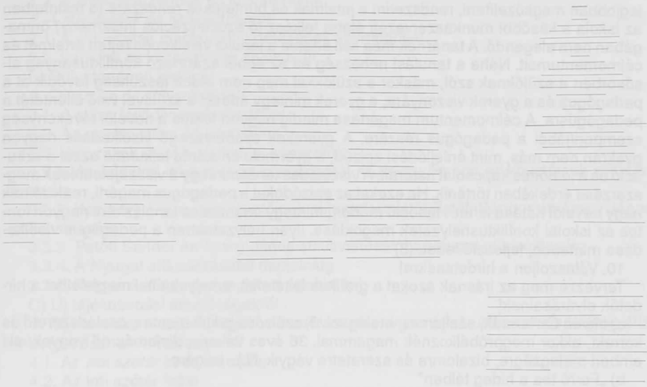
4. ábra Tagolások

figyelmét lekötni. Korántsem csak a hangerőről van szó (bár bizonyos minimális hangerő és modulációs variabilitás elengedhetetlen). A kommunikációs érzékenység fontos a gyerekek figyelmének, interakciós kedvének megállapítása szempontjából, amelyhez azután tudatosan vagy automatikusan a tanár nem verbális akcióit kapcsolhatja, vagy erősítheti intenzitásukat. Az iskolai situációban is gyakori, hogy egyes gyerekek otthoni problémáikat jelenítik meg olyan viselkedésformákban, amelyek a tanár munkáját vagy a gyerekek tanulását zavarják. E helyzeteket is kommunikációs megoldásokkal lehet a