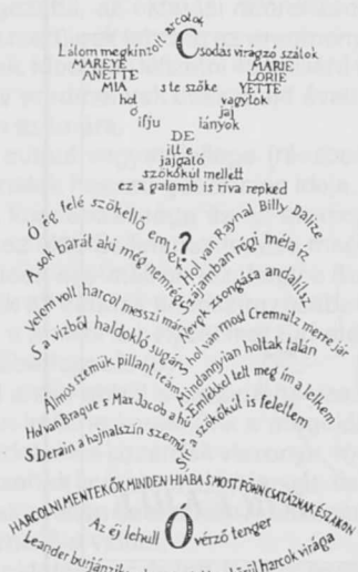
1. ábra Radnóti Miklós fordítása

Részlet a szerzők Szóbeli és írásbeli kommunikáció pedagógusjelölteknek című PSZM-pályázatából