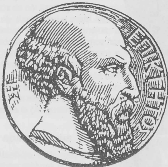
Epiktétosz (i.u. 50-130) az újsztoikus iskola legjelentősebb képviselője, frígiai származású rabszolga volt, akit később főlszabadítottak. Magyarul is megjelent „Kézikönyvecskéje” a „Szabadságról” című beszélgetése a sztoikus filozófia egyik alapkérdését feszegeti.

„...a lélek betegsége Zénón szerint hasonlatos a test beteges állapotához. Márpedig azt szoktuk mondani, a test betegsége alkotórészeinek, a melegnek és a hidegnek, a száraznak és a nedvesnek aránytalan állapota. (...) A testrészek aránya vagy aránytalansága