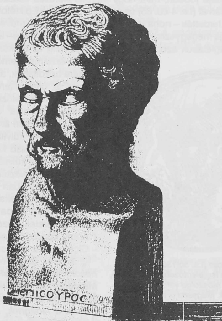
Epikureusz (kb. 342-271 i.e.)

Epikurosz tanításának fontos része, hogy az egyén mintegy kiléphet a társadalomból, és baráti társaságban, gyűlölködés nélkül élheti le létét.