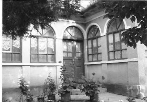
6. ábra. H. E. otthona, Mezőkeszű, 2006, magyarországi látogatók felvétele, színes

kontextualizálására, az élettörténetben való elhelyezésére), de a rögzült szerkezet szétesik és elsődleges szervező elemmé a látvány lép elő. Így a fényképekből kiolvasható biográfia egyik szembetűnő sajátossága, hogy az élettörténet időbeli elhelyezésében bizonytalan, néha kifejezetten pontatlan, sok esemény elhelyezése az időskálán csupán több éves becsléssel végezhető el. H. E. születésének éve például a róla készült első fényképből következtethető ki, a fényképen látható kislány életkorának becslésével, a megözevgyülés éve egyrészt a szomorú eseményt követő