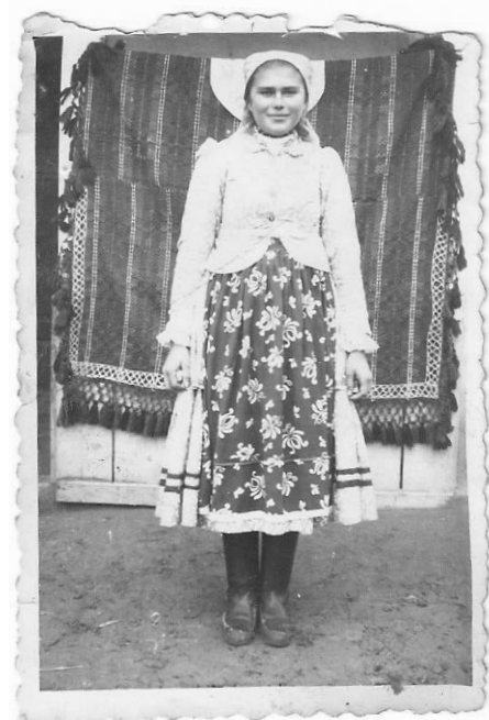
2. ábra. H. E., Mezőkeszű, 1956, amatőr fényképész felvétele

A kutatói narratívával és értelmezési stratégiákkal szemben H. E. tevékenysége oly módon rekonstrukciós tevékenység, hogy az aktuális látvány (a fénykép) a valamikori megélt élethelyzetekkel együttesen próbálja egységes egészzé, összefüggő történetté (történetekké) fűzni az egyedi szegmentumokat (fotókat). Bár az egyes fényképeket értelmező, kontextualizáló, főképp a látványra reflektáló szövegek önmagukban is értelmezhetőek (jól felismerhető és viszonylag konstans szerkezettel és formával rendelkeznek) (2), sorrendjük kötött: a kezdetben hosszabb, információban gazdagabb szövegek a fotókorpusz értelmezésében előrébb jutva rövidülnek, egyre gyakrabban tartalmaznak visszautalásokat (egy már korábban elmondott fényképértelmezésre, az alakuló, immár a kutatóval közösen birtokolt tudásra, közös értelmezési kontextusra). A szövegek többségének formai hasonlósága ellenére a fényképértelmezések igen széles tartalmi skálán