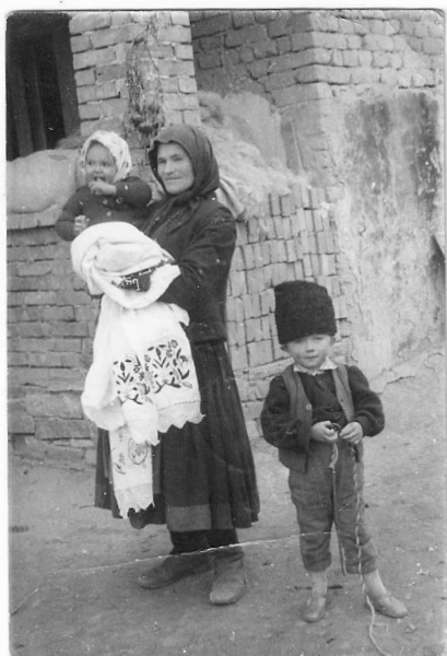
4. ábra. H. E. édesanyja és gyermekei (H. B. és H. L.), Mezőkeszi, 1960-as évek eleje

Egy harmadik, nehezebben tapintható osztályozási szempont szerint beszélhetünk hiányzó, de nyilvántartott fotókról, valamint jelen levő, de kívülállóként érzékelt fotókról. Az első csoportba például olyan, 1956-ban Kallós Zoltán néprajzkutató által készített fényképek tartoznak, melyeket H. E. emlékei szerint a kutatótól nem (mind) kapott meg. (6) A második csoportba tartozó fotók a korábban már érintett, a fotókorpusz határaitra, a privát fotó műfaji meghatározásra vonatkozó kérdéskört feszegetik – a fényképeket használó egyén szemszögéből (azaz mit tekint H. E. privát fotónak és mit nem). Olyan – látszatra privát fotónak tűnő – fényképek tartoznak ide, mint például egy korabeli sorzatfilm főszeplőinek H. L. által reprodukált portréi (iskolai fotókori gyakorlatként), melyek megtévesztésig hasonlítanak a családtagokról készült műtermi portrékhoz, vagy néhány rosszul sikerült kép, melyen H. E. „nem úgy néz ki”, ahogy illene vagy neki tetszene. Annak ellenére, hogy ezeket a fotókat az értelmezés során használójuk kevésbé értékesnek vagy kidobandónak, kívülállóknak titulálja, mégis a korpusz integráns részét képezik.