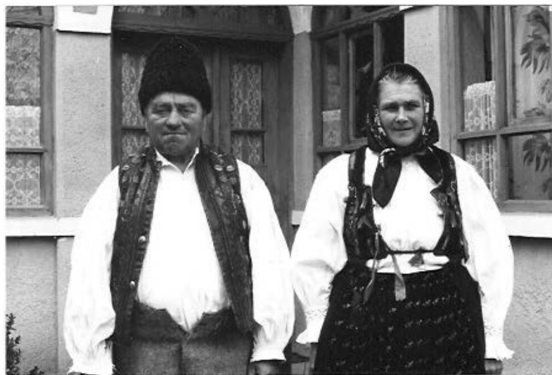
7. ábra. Beöltöz(tet)ve: H. E. és férje, Mezőkeszű, 2006, magyarországi látogatók felvétele

A konferencia tematikájához igazodva megragadjuk az alkalmat, hogy a privát fényképek kutatása során/kapcsán felmerülő, főként módszertani jellegű kérdéseket, többé-kevésbé határátlépésnek bizonyuló sajátosságokat sorjazzuk. Amennyiben a privát fotó módszerét elfogadjuk a társadalomtudományok területén alkalmazott kutatási módszerek, szükségessé válik a többi, klasszikus módszerrel, eszközzel történő összevetése, a