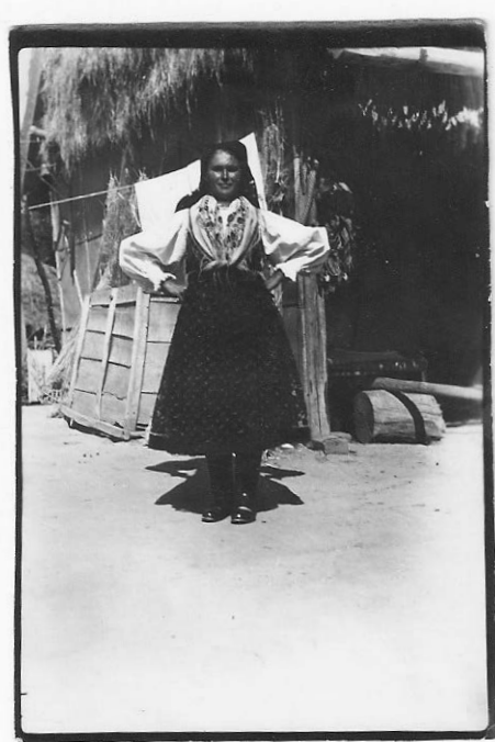
3. ábra. H. E. mezőkeszűi viseletben, 1956 (?)

A fényképek megrendelője szerint beszélhetünk belső, családi megrendelésű, esetenként saját készítésű fényképekről (5), melyeket H. E. és szűk családja készített, valamint külső megrendelésre készült fotókról, melyeket úgy küldtek H. E. rokonai, látogatói, ismerősei (sőt kutatók is). Érdekes megfigyelnünk, ahogyan a belső és a külső nézőpont a vizualitás talaján tetten érhető: a család használati tárgyai (fára aggatott száradó tejesedények), a falu látképe, jellegzetes helyei (határ, templom, temető), népviselete főként a H. E.-t meglátogató „idegenek” (például magyarországi táncházások) számára jelent megörökítő pillanatot, képez fényképtémát.