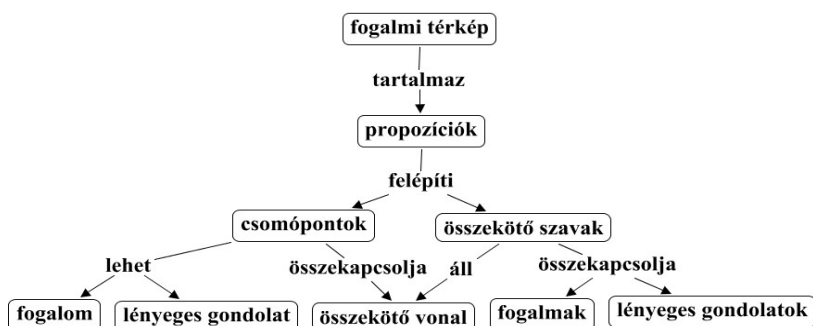
1. ábra. A fogalmi térkép felépítése (Habók, 2008)

A fogalmi térképről alkotott meghatározásokat áttekintve megállapítható, hogy a fogalmi térkép olyan grafikus reprezentáció, mely kulcsszavakból épül fel, a közöttük levő összeköttetés meg van nevezve. A megnevezés a vonalakon, illetve a nyilakon áll. A struktúráját tekintve hierarchikus felépítésű. A következőkben bemutatott vizsgálatban e szabályokat tartottuk szem előtt.