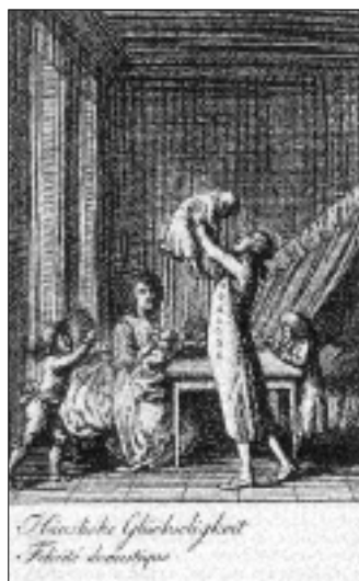
Daniel Chodowiecki: Házi örömök

A képen ábrázolt jelenetben mindenki megtalálta a helyét. A tetőről lekandikáló angyalok egy boldog, kiegyensúlyozottan harmonikus családot látnak, amelyben a nagymama megelégedett, a szülők gondoskodóak, a gyerekek jól neveltek, s még a háziállatok is teszik a dolgukat. Kiszámítható a gyerekek jövője is: ugyanolyan egyszerű, megbízható és becsületes kispolgárrá fognak válni nagykorukra, mint most szüleik. Zökkenőmen-