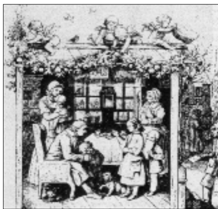
Ludwig Richter: Újévi üdvözlés (1862)

Ha még egy pillantást vetünk e két illusztrációra, akkor észrevehetjük, hogy az apa mindkét képen központi alakként, mintegy „referencia-személyként” jelenik meg: minden tekintet rá szegeződik, a többi szereplő figyelmé felé irányul. Ezek a hétköznapi életből átvett, művészi eszközökkel felerősített gesztusok megerősítik a tételt, amelyet Ludwig Fertig német történész fogalmaz meg. Eszerint az apák a 19. század során ismét fokozott tekintélyre és autoritásra tettek szert, amelynek forrása megnövekedett társadalmi szerepük volt. Az édesapák mint dolgozó polgárok a külvilágban nap mint nap átérték az alá-fölérendeltségi viszonyok megerősödését, s – akár munkaadók, akár munkavállalók voltak – a családban is ezt a hierarchiára törekvést képviselték. Gyerekeiktől való távolodásukat fokozta, hogy dolgozó apaként kereső foglalkozásuk színtere ekkor már általában nem a családi ház volt. A távollevő apa figurája így olyan értékek hordozójává lett, mint a fegyelem, a rendezettség és a védelem, míg az otthon érzelmi melegségének megteremtésére, a szeretet nyújtására való képesség egyre inkább az anya személyéhez kötődött. ( Fertig, 1984 )