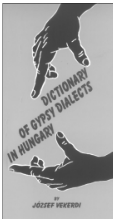
A Kálvin Kiadó és a Terebess Kiadó könyveiből