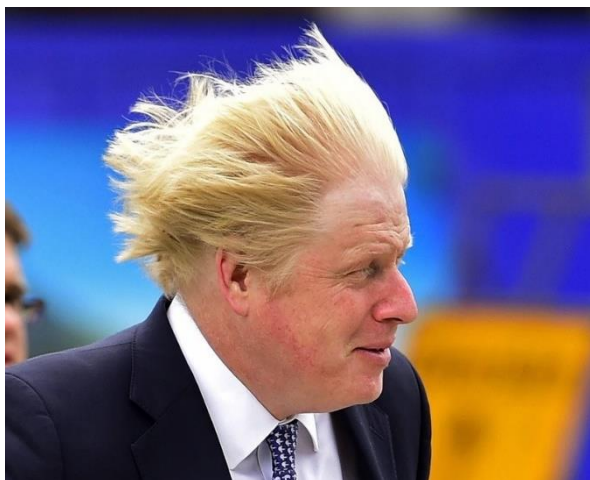
5. ábra: Boris Johnson, brit politikus, 2019–2022 között az Egyesült Királyság miniszterelnöke

A mai olvasó számára már naivnak, áltudományosnak tűnnek ezek a modern pszichológiát, orvostudományt megelőző nézetek, ugyanakkor tagadhatatlanul máig gondolkodásunk részét képezik ezek a sémák. Manapság is gyakran ér vád politikusokat a frizurájuk, vagy éppen az öltözködésük miatt. Ami nem változott, az a jelenség komplexitása, vagyis, hogy nem lehet önmagában, a kontextus ismerete nélkül dekodolni az adott ismertetőjegyeket.