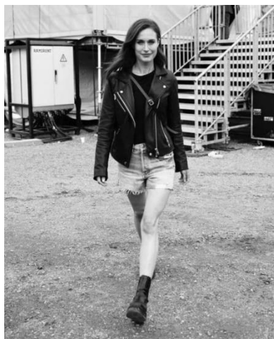
6. ábra: Sanna Marin, 2019–2023 között Finnország miniszterelnöknője