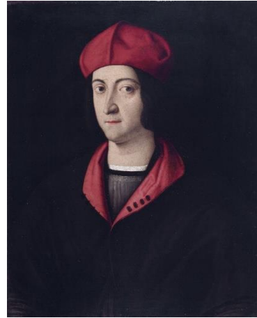
2. ábra: Bartolomeo Veneto: Ippolito d'Este bíboros képmása , 1510 körül. Elárverezve: Dorotheum, Bécs, 2012. október 17. 524. tétel

Érdeemes Equicola leírását Ippolito portréival is összehasonlítani, feltűnő ugyanis a szöveg sagax (kifinomult szaglású, vagyis éleseszű) jelzője és a portrékon ábrázolt kutyaszerű, hosszú orr közötti párhuzam: In caelum illi puerilem educationem ferant, quos latet eum esse ingeniosissimum et praeceteris mansuetum atque virilem, acutum et sagacem , docilem et memoria optima. 17 Az intelligenciát szimbolizáló, kutyaszerű orr ábrázolásaira több képzőművészeti analógiát is találhatunk, többek között a zoológiai fiziognómia reneszánszkori képviselőjének, Giovanni Battista della Portának metszetekkel illusztrált művében, de Tiziano a Bölcsesség allegóriája című festményén is kutya szerepel az ifjú attribútumaként.