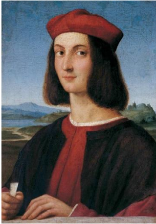
1. ábra: Raffaello Santi: Ifjú képmása (Ippolito d'Este?) 1502–1505 körül. Budapest, Szépművészeti Múzeum