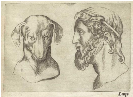
3. ábra: Giambattista della Porta: De humana physiognomonia , 1586.

Érdeemes Equicola leírását Ippolito portréival is összehasonlítani, feltűnő ugyanis a szöveg sagax (kifinomult szaglású, vagyis éleseszű) jelzője és a portrékon ábrázolt kutyaszerű, hosszú orr közötti párhuzam: In caelum illi puerilem educationem ferant, quos latet eum esse ingeniosissimum et praeceteris mansuetum atque virilem, acutum et sagacem , docilem et memoria optima. 17 Az intelligenciát szimbolizáló, kutyaszerű orr ábrázolásaira több képzőművészeti analógiát is találhatunk, többek között a zoológiai fiziognómia reneszánszkori képviselőjének, Giovanni Battista della Portának metszetekkel illusztrált művében, de Tiziano a Bölcsesség allegóriája című festményén is kutya szerepel az ifjú attribútumaként.