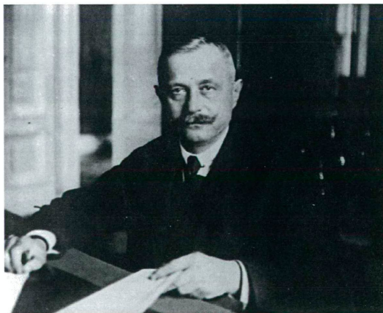
Nagyatádi Szabó István földművelésügyi miniszter