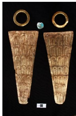
Fig. 4 Ofrendas de oro asociadas a la tumba de Dama de Pacopampa

Durante estos trece años de investigación, siempre he tenido en cuenta la colaboración con la comunidad a través de reuniones de explicación del trabajo y exposiciones temporales de las piezas recuperadas en las excavaciones (Seki, 2017). Además, hemos encargado a la comunidad la selección y el salario de los trabajadores del proyecto. Este esfuerzo surtió efecto y la Asociación Cultural de Pacopampa fue fundada voluntariamente para conservar el sitio arqueológico en el año 2012. El motivo de la fundación de la asociación fue el descubrimiento de tumbas con ofrendas suntuosas (Fig. 4).