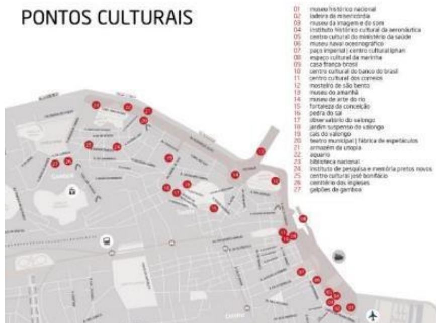
Figura 16: Região Portuária – Pontos Culturais

Nos tempos atuais, há uma grande valorização do monumento como um bem cultural, sendo tratados como pequenos parques temáticos e atraindo diversos turistas de diferentes regiões, ocasionando numa gentrificação do local, de acordo com Mezentier, Moreira (2014, 46-49). Tal cenário só foi possível ter se tornado realidade por causa da desapropriação da população local da área, acarretando nessa atração do “público consumidor”.