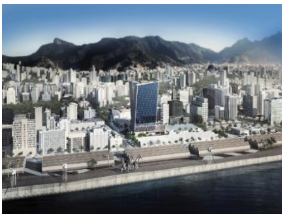
Figura 17: Região Portuária – Pontos Culturais

Por causa da grave crise econômica que assola o país de uma certa forma, não houve os investimentos esperados. Assim, torna-se possível ver regiões urbanas vazias, com torres isoladas e de pouco uso. A crise foi benéfica para a região portuária, pois não permitiu a construção de vários edifícios na orla, nos quais bloqueariam visão de antigos e tradicionais edificações.