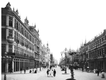
Figura 8: Avenida Central, logo após a reforma Pereira Passos