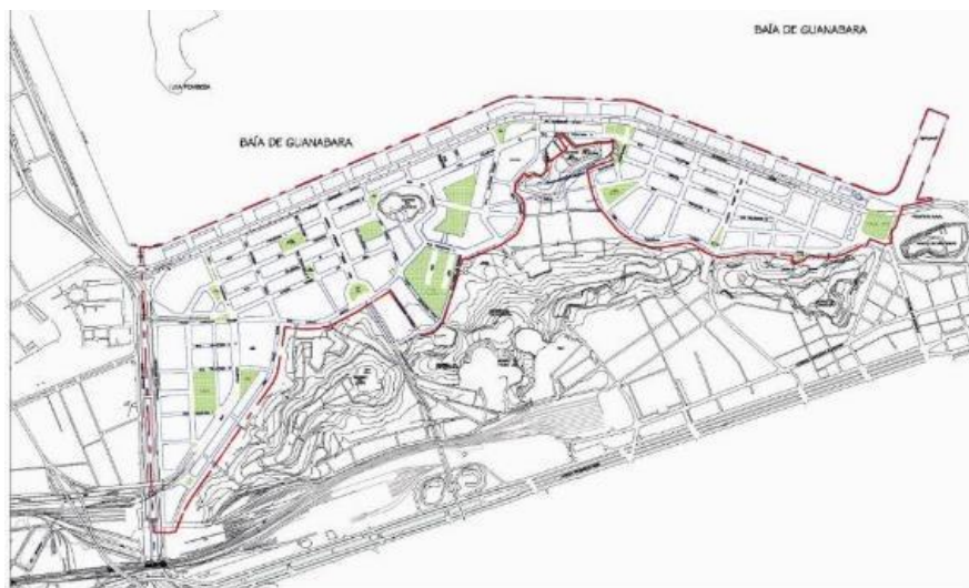
Figura 12: Área de implantação do projeto Porto Maravilha