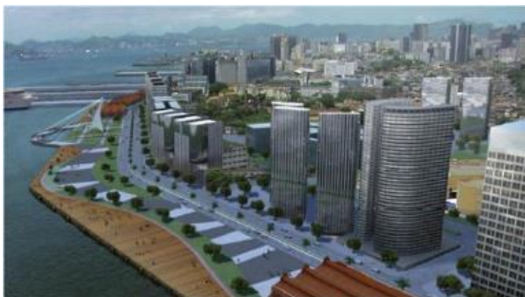
Figura 20: Região Portuária – projeto Porto Cidade

Como o espaço é o entrecruzamento de trajetórias e histórias, é preciso entender as relações sociais, econômicas e culturais de um local como afirma Massey (2008: 33). Sem esse entendimento, projetos de reestruturação, como o Porto Maravilha, que alteram a identidade local, correm sérios riscos de naufragar.