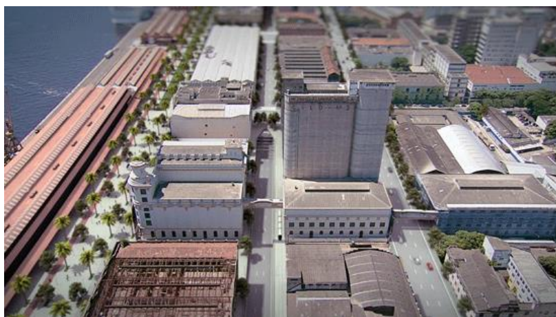
Figura 14: Região Portuária – Via Binário e Orla Conde (Fonte: Adaptado do Projeto Porto Maravilha, Prefeitura da Cidade do Rio de Janeiro, 2017)

As reformas viárias foram intensas, como a demolição da Perimetral, onde ela foi substituída por duas vias arteriais: a via Binário e o túnel Marcelo Alencar. A ideia inicial era demolir a Perimetral até a Praça Mauá, onde o túnel se emergiria e a própria Perimetral continuaria como o principal acesso ao Gasômetro. Com essa alteração, surgiu-se a Orla Conde, ligando a Praça Mauá ao AquaRio.