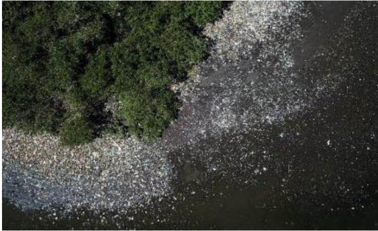
Figura 3: O lixo na Baía de Guanabara em maio de 2019

dinâmica humana. O meio ambiente é em si uma categoria histórica. Meio Ambiente não é igual à “Natureza” ou “Ecossistema”: implica natureza e ecossistemas como estrutura de ação humana (Polónia, 2016: 39).