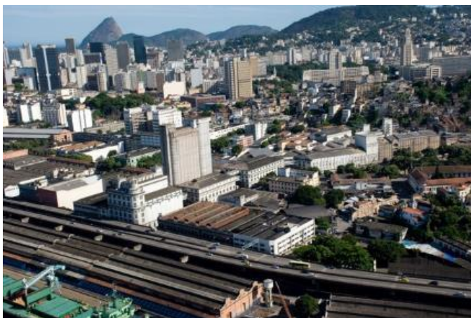
Figura 13: Região Portuária antes da Intervenção

As reformas viárias foram intensas, como a demolição da Perimetral, onde ela foi substituída por duas vias arteriais: a via Binário e o túnel Marcelo Alencar. A ideia inicial era demolir a Perimetral até a Praça Mauá, onde o túnel se emergiria e a própria Perimetral continuaria como o principal acesso ao Gasômetro. Com essa alteração, surgiu-se a Orla Conde, ligando a Praça Mauá ao AquaRio.