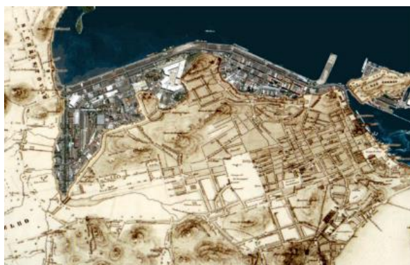
Figura 10: Área de aterro na região portuária com suas diversas camadas temporais

A obra do porto foi a maior realizada no início do século XX, com a retificação do litoral da região, onde antes existiam pequenas enseadas, baías e manguezais. A preocupação da época era o montante de ocorrências de doenças como a gripe espanhola, a malária, junto aos portos, como em Santos, que sofreu uma interdição em suas operações. A região era muito estrangulada, não suportando as grandes embarcações. Houve pouca preocupação com a população local, numerosa no início do século XX, que ocupava os morros (favelas), como a da Providência, a primeira do município (Santos, 2011).