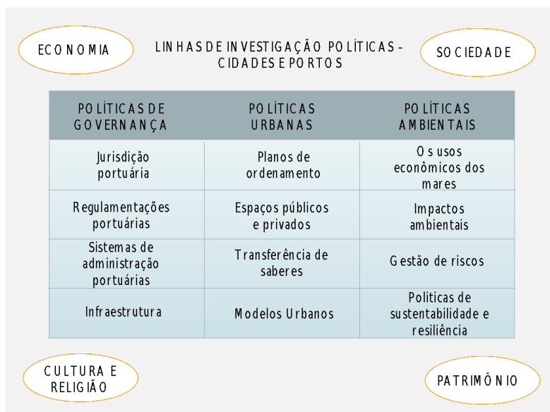
Figura 5: Linhas de Investigação Políticas – Cidades e Portos (Fonte: Autora, 2019, baseado na apresentação de Polónia, 2018)

A partir do século XX, os portos e as cidades se separam e se desenvolvem separadamente. O processo evolutivo das atividades marítimas levou a uma menor demanda de profissionais, gerando o abandono e a degradação da região. O quadro atual é complexo. A cidade-porto, que por vários anos serviu como uma praça de negociação, está submetida a pressões dos horizontes terrestre e marítimo e corre riscos de ser transformada em um mero espaço transitório com projetos de reestruturação voltados muito mais para o fator turístico do que aos moradores locais geram a gentrificação do espaço. Como o porto deve funcionar nessa nova realidade? (Monié – Vasconcelos, 2019).