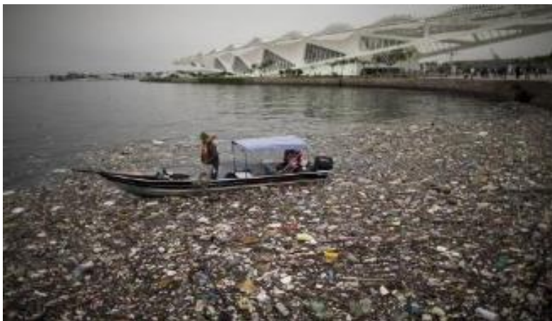
Figura 2: O lixo na orla e no mar

no aumento de gases poluentes; no desmatamento; na poluição das águas (rios e oceanos). Logo, se o modo de “usar” os recursos aquáticos oferecidos pelo planeta não mudar, o modo de vida como conhecemos irá acabar.