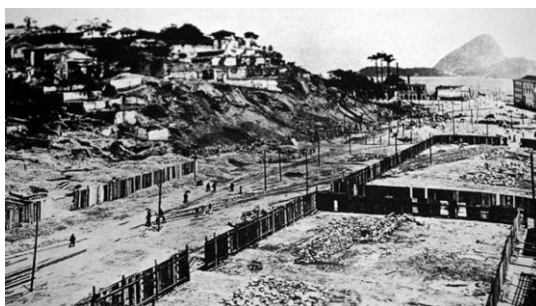
Figura 7: A abertura da Avenida Central

O Rio comandava, no final do século XIX, as atividades portuárias brasileiras e, ao redor, um colar formado de empresas voltadas ao comércio, serviço e indústria. A primeira grande mudança na região portuária foi durante o governo de Pereira Passos, quando ocorreram modificações marcantes, tais como a implantação do bonde elétrico, a construção do Teatro Municipal, a demolição dos cortiços, a abertura da Avenida Central (atual Rio Branco) (Abreu, 2013).