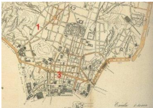
Figura 9: Traçados da reforma de Pereira Passos

As mudanças urbanísticas de Pereira Passos ficaram marcadas pelo aterro com pedaços do Morro do Castelo e deslocamento da operação para o Caju, com pontos de atracação mais modernos (Rabha, 2006).