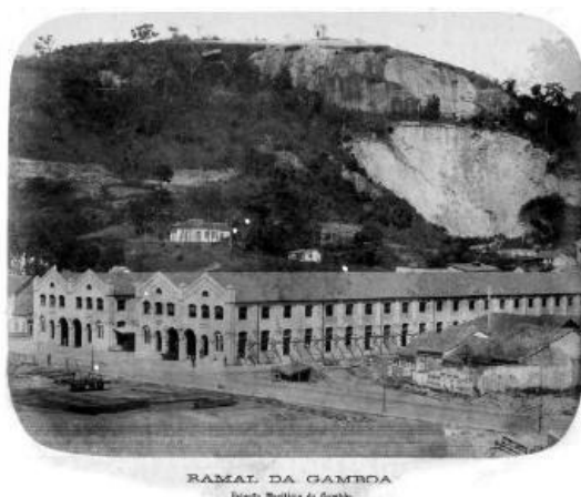
Figura 11: Instalações do Cais da Gamboa

As instalações do Cais da Gamboa, a grande obra portuária do início do século XX, com 3.150m, 20 berços, calado de 7 a 10.30m, com 18 armazéns “internos” com 60.000 m 2 e 16.000 m 2 de área descoberta, ficaram defasadas frente aos conceitos mais modernos de operação e logística portuária (Rabha, 2006: 252).